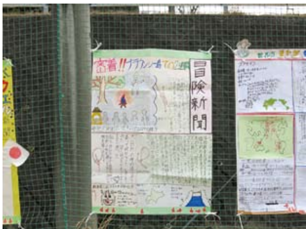
ベスト新聞賞 (市原第3団)